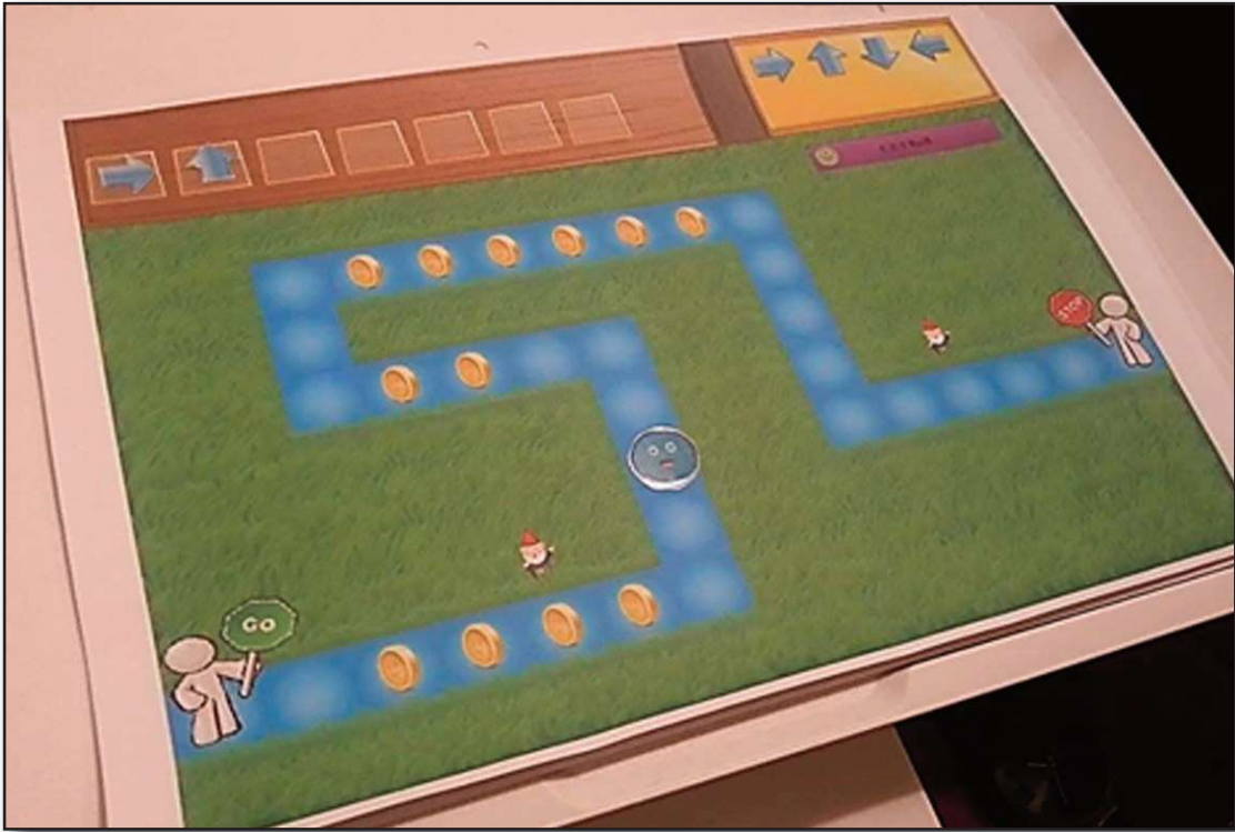
Εικόνα 3: Το επιτραπέζιο παιχνίδι

Ο τρόπος διδασκαλίας και εργασίας των παιδιών ήταν ο ίδιος με την πρώτη ομάδα. Επιπρόσθετα, πριν από την κάθε δραστηριότητα, ο εκπαιδευτικός έδινε σε έντυπο το τι έπρεπε να υλοποιήσουν τα παιδιά με το επιτραπέζιο. Στην ουσία, τα έντυπα αυτά περιλάμβαναν τις ίδιες οδηγίες που λάμβαναν οι μαθητές που χρησιμοποιούσαν την εφαρμογή. Η τοποθέτηση των διαφόρων στοιχείων του επιτραπέζιου γίνονταν από τους μαθητές, οι οποίοι εργάζονταν κατά ζεύγη, όπως και στην προηγούμενη μέθοδο (Εικόνα 4). Ο εκπαιδευτικός αναλάμβανε την “εκτέλεση” του “προγράμματος” ώστε να διαπιστωθεί αν “λειτουργούσε”. Ακολουθούσαν δραστηριότητες στην τάξη (ατομικές ή ομαδικές με φύλλα εργασίας και παιχνίδια), ίδιες με την προηγούμενη ομάδα.