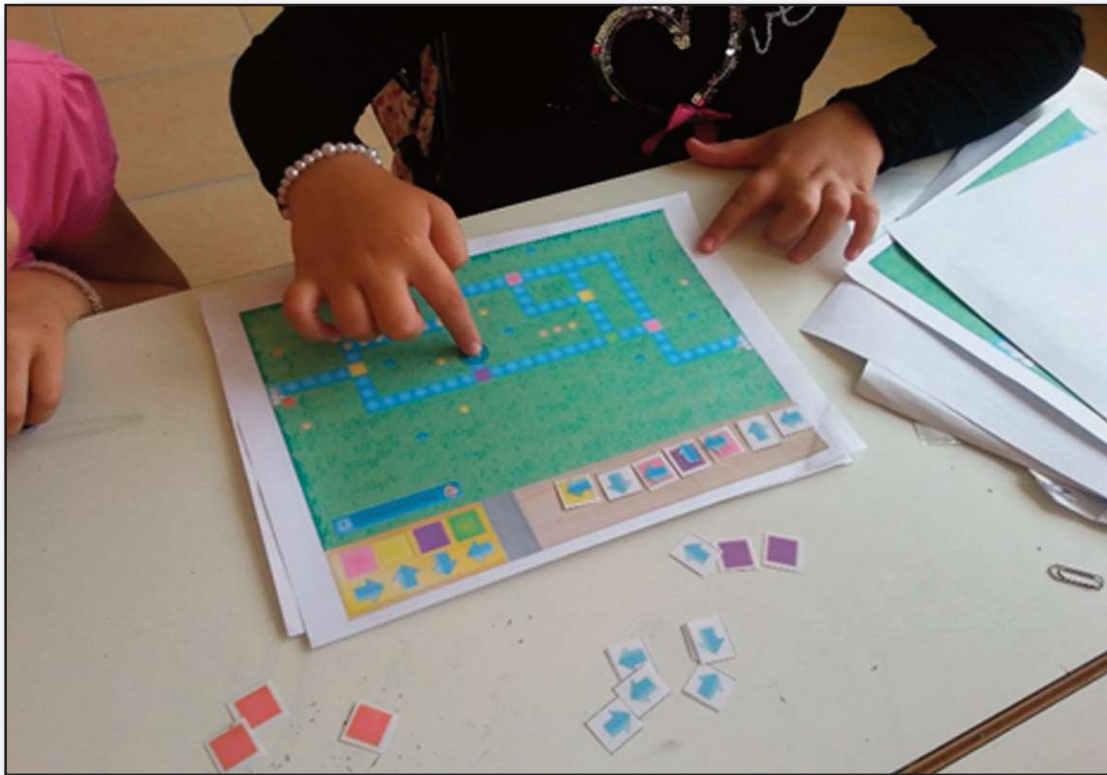
Εικόνα 4: Τρόπος εργασίας της ομάδας μαθητών που χρησιμοποίησαν το επιτραπέζιο παιχνίδι

Μία τρίτη ομάδα αποτέλεσε την ομάδα ελέγχου. Η ομάδα αυτή διδάχθηκε συμβατικά χωρίς να χρησιμοποιηθούν τεχνολογικά μέσα (ταμπλέτες ή ηλεκτρονικοί υπολογιστές) ή άλλο εποπτικό υλικό (επιτραπέζιο παιχνίδι). Αντί αυτών, έγινε συγγραφή σημειώσεων που αφορούσαν τις προγραμματιστικές έννοιες που αποφασίστηκε να αξιοποιηθούν για τις ανάγκες της παρούσας έρευνας. Για λόγους όμως συμβατότητας με τις προηγούμενες μεθόδους, οι σημειώσεις ακολουθούσαν τη φιλοσοφία και τον τρόπο παρουσίασης που ακολουθούσε η εφαρμογή Kodable και το επιτραπέζιο παιχνίδι (πίστες, χώρος συμπλήρωσης των εντολών, χρήση συμβόλων για την αναπαράσταση των εντολών, κτλ.). Το ίδιο έγινε για τις δραστηριότητες και τις ασκήσεις. Να σημειωθεί ότι οι δύο αυτές ομάδες αξιολογήθηκαν με τα ίδια φύλλα αξιολόγησης και post-test όπως η πρώτη, αλλά δεν τους δόθηκε το ερωτηματολόγιο εντυπώσεων. Συνοπτικά η μέθοδος εργασίας των τριών ομάδων μαθητών παρουσιάζεται στον Πίνακα 1.