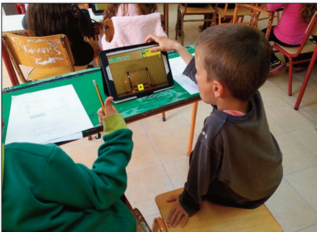
Εικόνα 2: Τρόπος εργασίας της ομάδας των μαθητών που χρησιμοποίησαν την εφαρμογή

Με την ολοκλήρωση της διδασκαλίας κάποιας έννοιας οι μαθητές συμπλήρωναν - ατομικά- φύλλα αξιολόγησης (τρία συνολικά). Κάθε φύλλο αξιολόγησης αποτελούταν από τρία διακριτά μέρη. Το πρώτο περιλάμβανε ερωτήσεις πολλαπλής επιλογής, σωστού-λάθους και συμπλήρωσης κενών, που αφορούσαν την εκάστοτε προγραμματιστική έννοια. Σε κάθε φύλλο αξιολόγησης υπήρχαν τουλάχιστο έξι ερωτήσεις σε αυτό το μέρος. Στο δεύτερο σκέλος, οι μαθητές καλούνταν να μεταγράψουν, με όρους και έννοιες του προγραμματισμού, καταστάσεις και ενέργειες της καθημερινότητας. Για